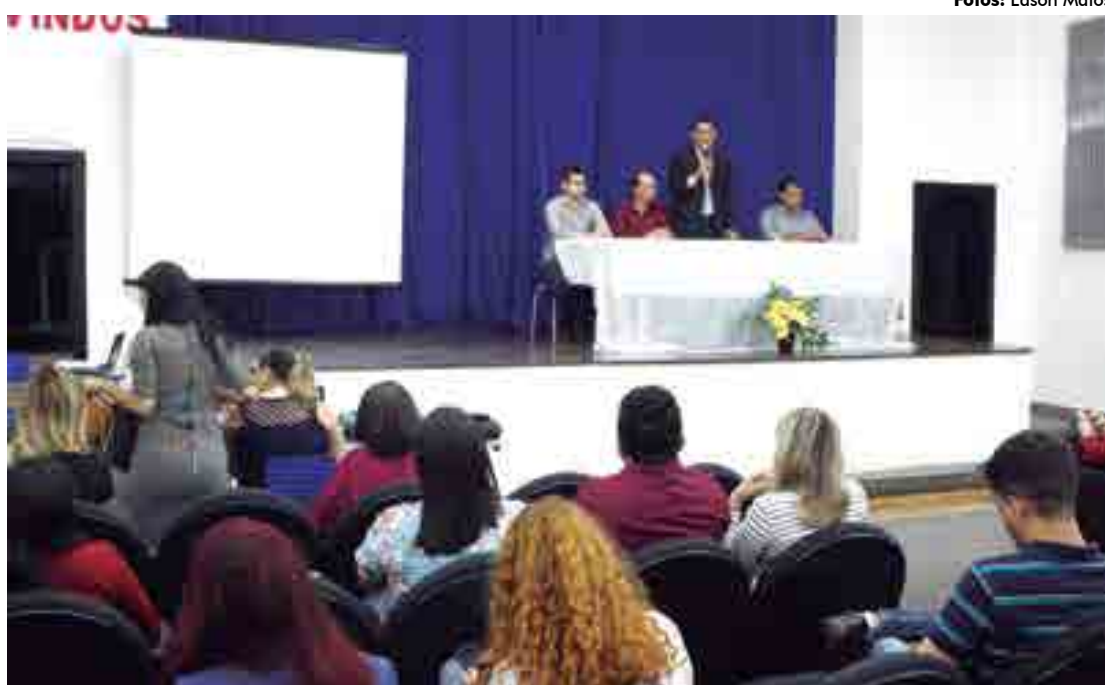
Dados do Índice de Educação da Paraíba 2018 foram apresentados ontem durante coletiva de imprensa no Liceu Paraibano

O secretário também enfatizou a importância de dar continuidade a esse crescimento nos próximos anos. “A Paraíba já escolheu que esse trabalho continue. O governador eleito João Azevêdo vai ter esse desafio de dar continuidade a essas políticas e fazer mais, como a gente tem falado, fazer o andar de cima, fazer o resultado. Várias ações que vão motivar os alunos e professores. Sabendo fazer a liderança da sua escola, com presença da sua escola, cada vez mais alunos presentes e estudiosos. Esse processo é que vai fazer essa continuidade para que a gente dê um salto”, comentou.