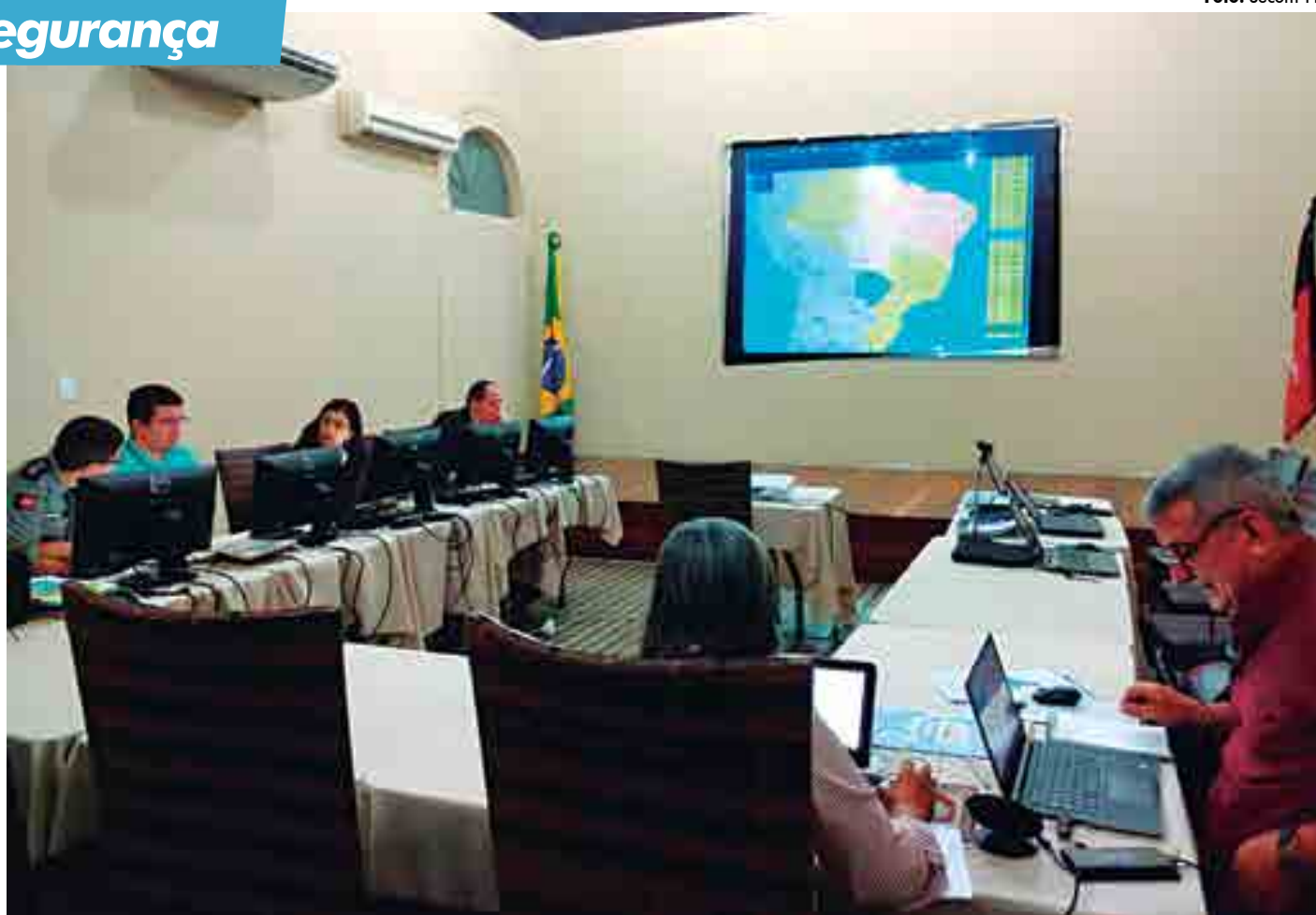
‘Operação Enem’ foi acompanhada em tempo real a partir dos Centros de Comando e Controle instalados pela PM nas cidades de JP, CG e Patos