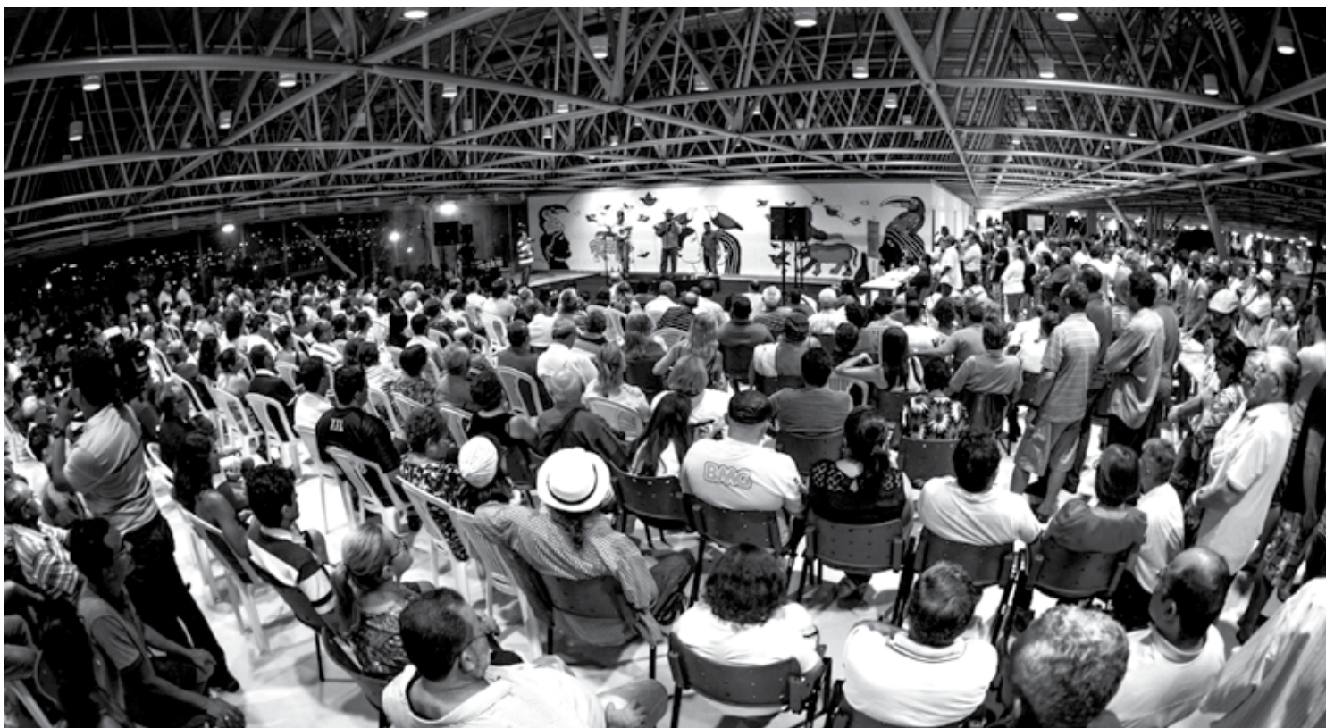
Desafio de repentistas entre estados vai acontecer amanhã, no mezanino do Espaço Cultural, com entrada franca, numa realização do Governo do Estado