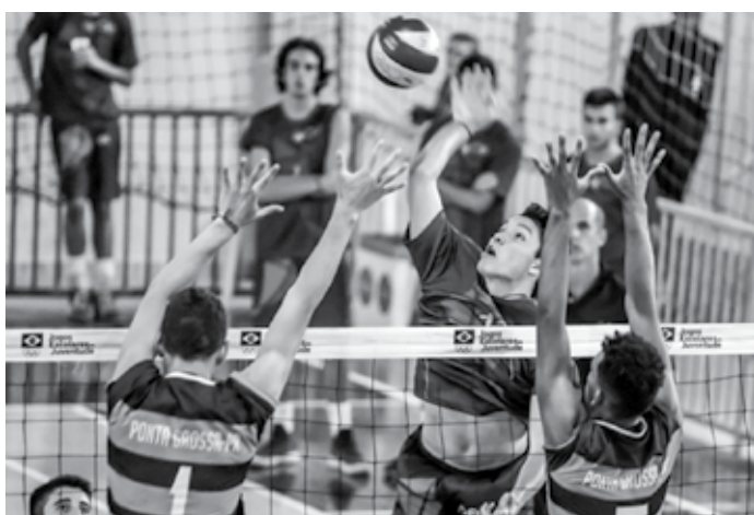
A partir do próximo dia 22 começam os jogos com 2.136 escolas

O Comitê Olímpico do Brasil (COB) já está em Natal (RN) para organizar a maior etapa já realizada dos Jogos Escolares da Juventude, entre os dias 12 e 25 deste mês. Remodelada esse ano, a principal competição estudantil do país terá a participação de mais de 5 mil atletas dos 26 estados brasileiros, além do Distrito Federal e uma delegação do Japão. O Centro de Convivência do evento, em Ponta Negra, vai receber pela primeira vez atletas das duas categorias de idade - 12 a 14 e 15 a 17 anos, de 2.136 escolas de todo o país.