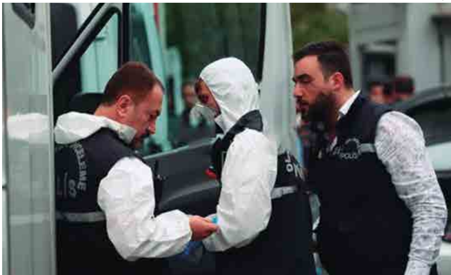
Polícia forense examina a residência do cônsul saudita em Istambul, na tentativa de encontrar provas sobre o assassinato do jornalista Jamal Khashoggi

O político turco Yasin Aktay afirmou na sexta-feira ao jornal "Hürriyet" que os assassinos esquartejaram o corpo para poder "dissolvê-lo" em uma substância química e se desfazer do mesmo mais facilmente, um ponto que ainda não foi confirmado