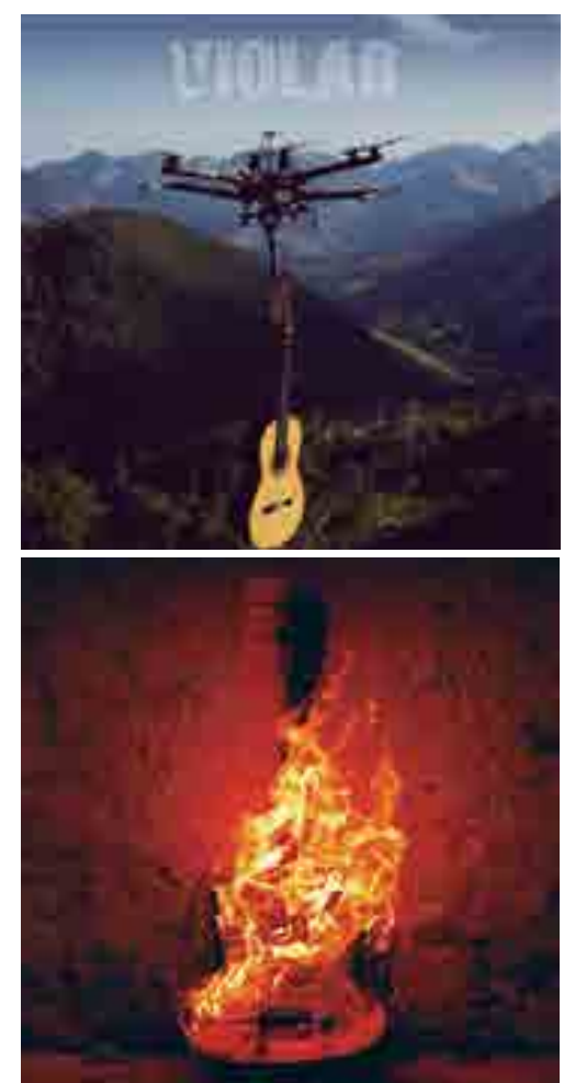
Capas do CD e LP que fazem parte do projeto Violab, feitas pelos fotógrafos Paulo Vainer e Luiza Gama

Além de proporcionar vendas exclusivas por seu endereço eletrônico, o portal Violab ainda traz um pouco da cultura do violão, bem como outras informações, a exemplo da agenda de shows.