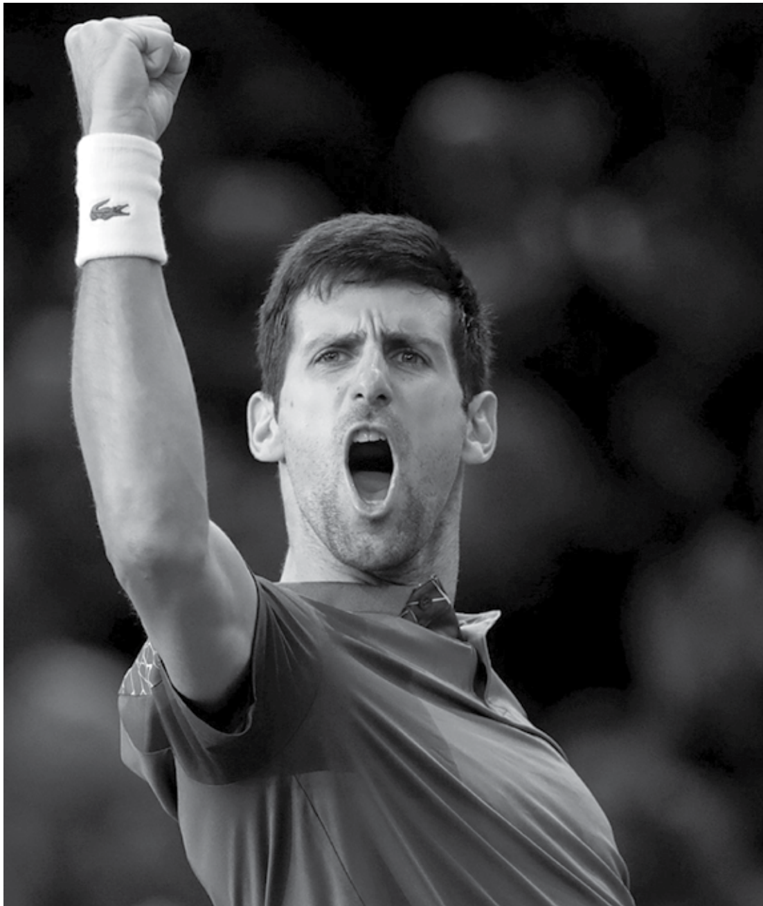
O sérvio venceu Federer no sábado e chegou à final do Masters de Paris, mas perdeu para o russo Karen Khachanov

Para retomar a colocação, o sérvio precisou superar diversos obstáculos nos últimos 18 meses. Ele encerrou a temporada passada de forma precoce, em julho,