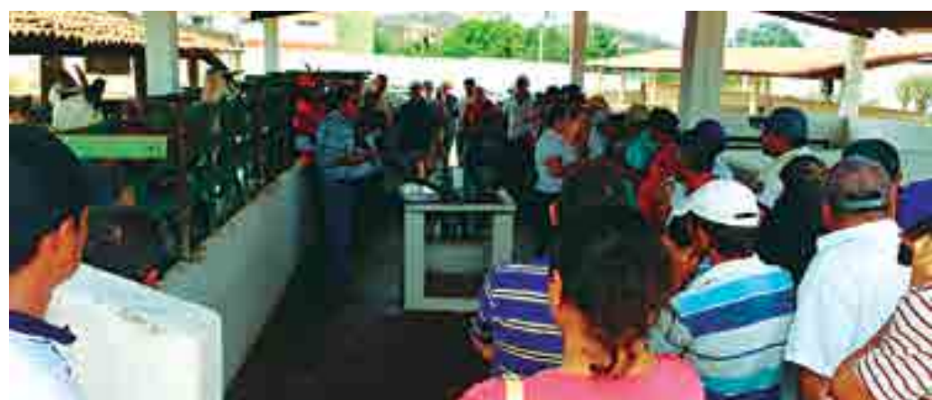
Criadores do Cariri paraibano participam de cursos com técnicos da Emater-PB na cidade de Taperoá