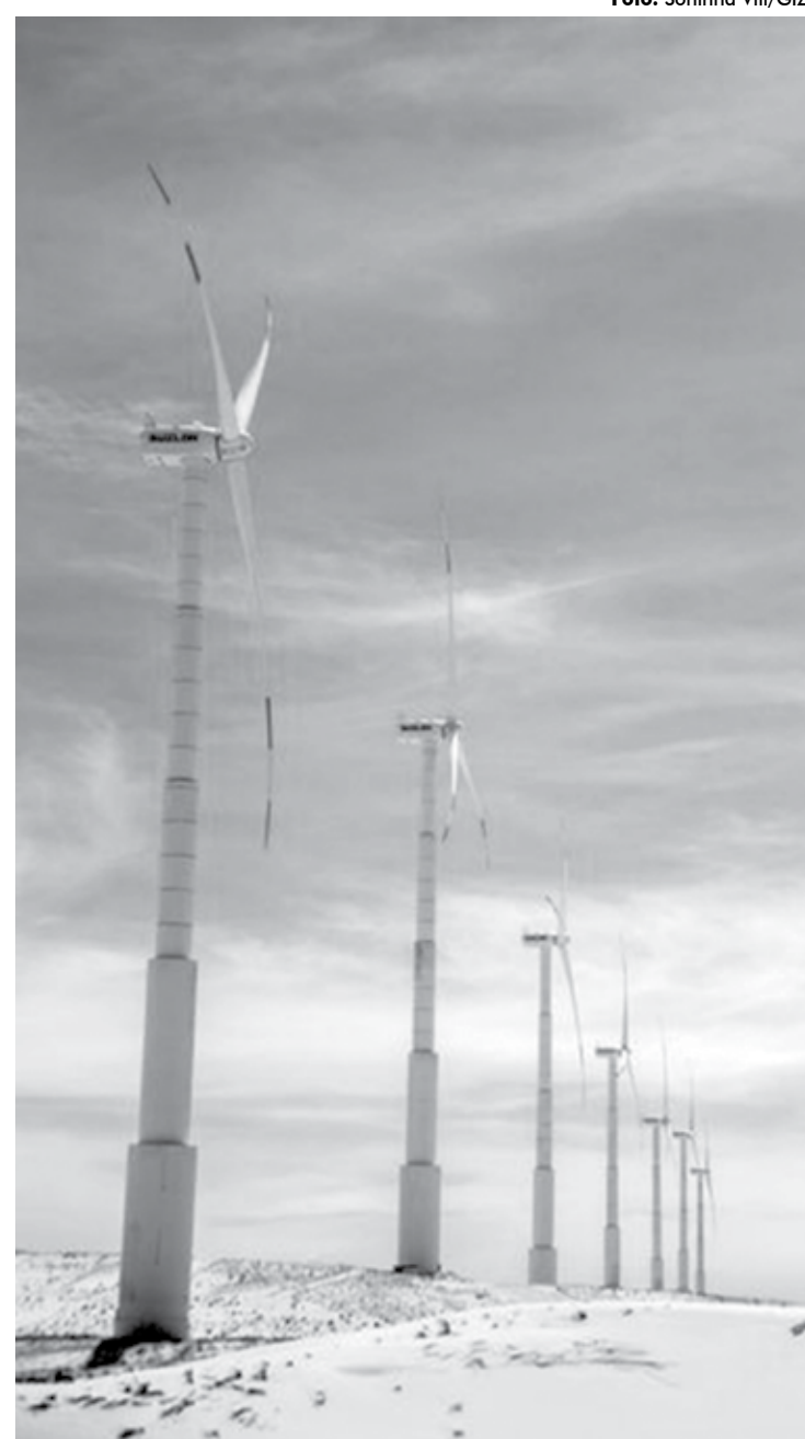
Brasil tem 568 parques eólicos e mais de 7.000 aerogeradores em 12 estados

"O dado mais recente de recorde da região é do dia 13 de setembro, uma quinta-feira, quando 74,12% da demanda foi atendida pela energia eólica, com geração média diária de 7.839,65 MW-med [megawatts médio] e fator de capacidade de 76,58%. Nesta data, houve uma máxima às 8h, com 82,34% de atendimento da demanda e 85,98% de fator de capacidade. Vale mencionar também que, nesse mesmo dia, o Nordeste foi exportador de energia durante todo dia, uma realidade totalmente oposta ao histórico do submercado que é por natureza importador de energia", disse a Abeeólica.